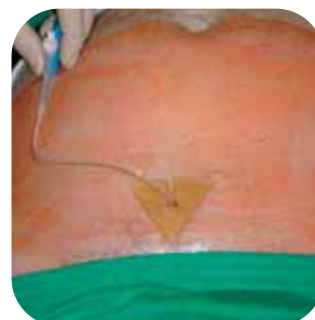
Versorgung von suprapubischem Blasenkatheter mit GLYCOcell® SondoFIX®